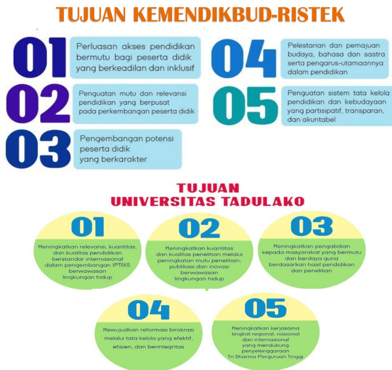
Gambar 1.5 Keselarasan Tujuan Universitas Tadulako dengan Tujuan Kemendikbud Ristek

Perumusan tujuan UNTAD tahun 2020-2024 ditujukan untuk menggambarkan ukuran-ukuran terlaksananya misi dan tercapainya visi. Universitas Tadulako menetapkan lima tujuan yang selaras dengan tujuan Kemendikbud Ristek.