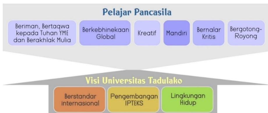
Gambar 1.3 Keselarasan Profil Pelajar Pancasila Terhadap Visi Universitas Tadulako

Visi ini sangat strategis, karena akan menjadi rujukan dalam menetapkan berbagai kebijakan penyelenggaraan tri dharma perguruan tinggi di Universitas Tadulako dalam kurun waktu 2020-2045. Perumusan visi Universitas Tadulako sesuai dengan Visi dan Kemendikbud tersebut.