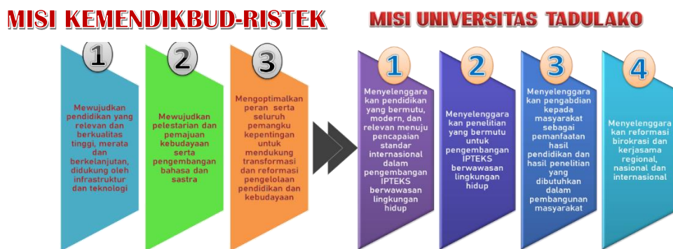
Gambar 1.4 Keselarasan Misi Universitas Tadulako dengan Misi Kemendikbud-Ristek

Pencapaian Visi Universitas Tadulako sesuai tugas dan kewenangannya, melaksanakan Misi yang sejalan dengan Misi Kemendikbud yakni tertera pada Gambar 2.2.