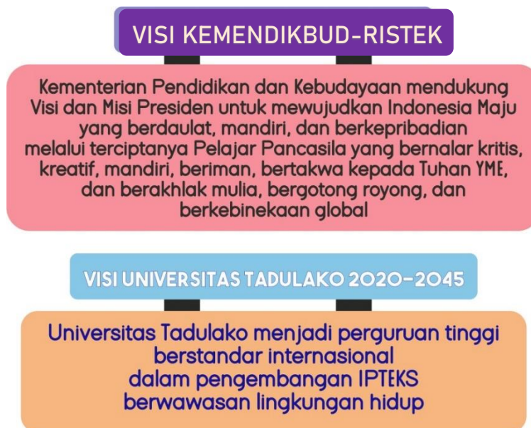
Gambar 1.2 Keselarasan Visi Kementerian dengan Visi Universitas Tadulako

Visi ini sangat strategis karena akan menjadi rujukan dalam menetapkan berbagai kebijakan penyelenggaraan pendidikan atau Tri dharma perguruan tinggi di Universitas Tadulako dalam kurun waktu 2020 - 2045, dengan penjelasan sebagai berikut: